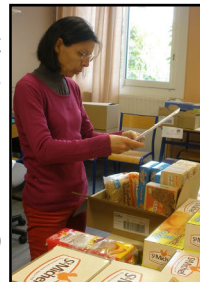
Une erreur est possible. Il faut vérifier !

Même si celles-ci ont été en baisse (105 commandes) par rapport à décembre 2014 (142 commandes), l'ex-