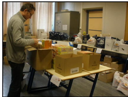
Préparation des commandes sans se laisser tenter à goûter !

Alors qu'au mois de septembre, en réaction à la baisse des moyens alloués au collège par l'Inspection académique, l'annulation d'un certain nombre de projets nous était confirmée, l'A.I.P.E. a fait le choix de maintenir l'action « Commande de Galettes St Michel et de chocolats Léonidas » 2015.