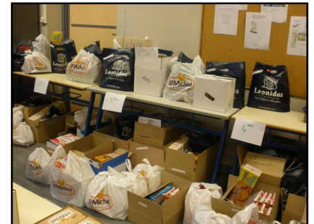
Les commandes sont prêtes !

D'autres initiatives pourraient également être soutenues par l'association notamment celles en faveur du temps méridien.